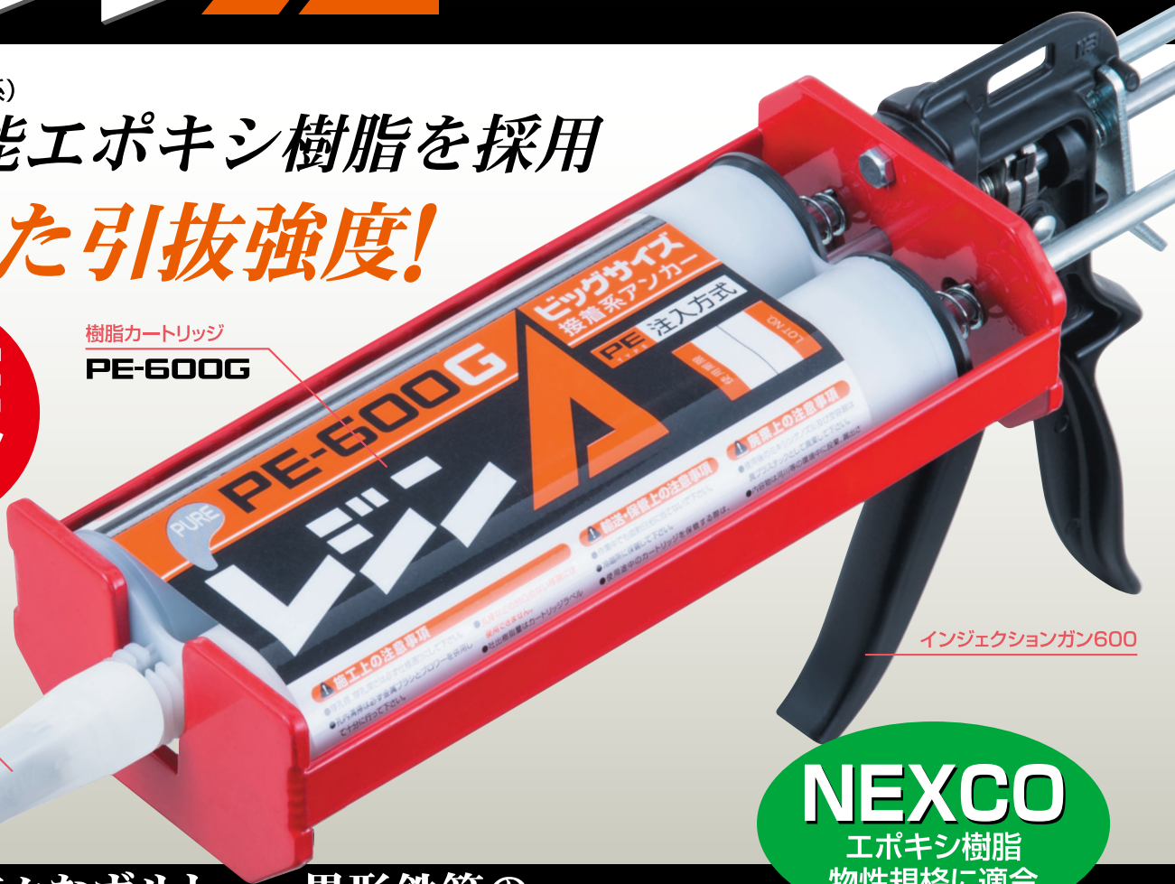
インジェクションガン600